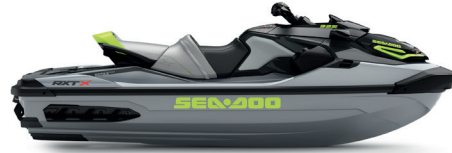
Ice Metal and Manta Green