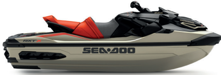
NEW Metallic Tan and Lava Red Premium