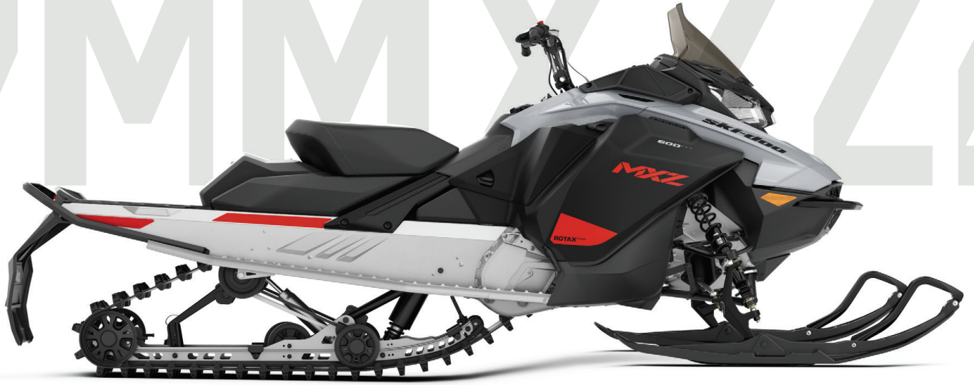
MXZ® SPORT KUVASSA