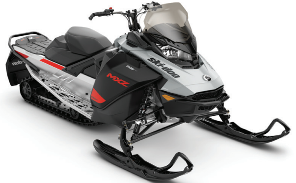
MXZ® SPORT KUVASSA