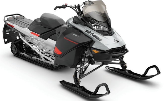
BACKCOUNTRY™ SPORT KUVASSA